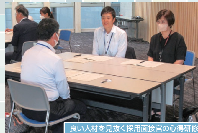
良い人材を見抜く採用面接官の心得研修