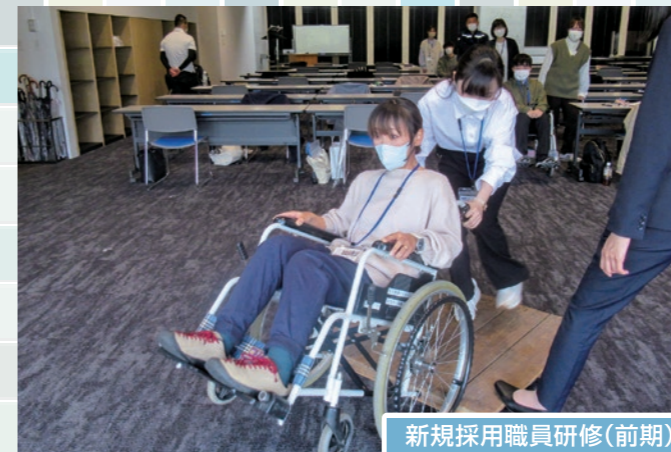
新規採用職員研修(前期)

今年度も新規採用職員研修(前期)を皮切りに研修がスタートしました。感染症対策は緩和されましたが、コロナ禍での経験を活かして、より一層皆さんに「研修を受講してよかった」と思ってもらえるよう邁進してまいります。今年度も皆さんの積極的なご参加をお待ちしています。