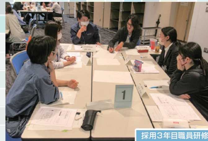
採用3年目職員研修