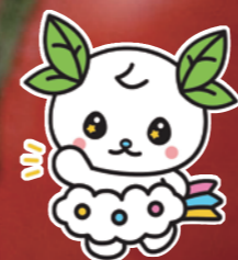
津野町オフィシャル マスコットキャラクター 「ちやつのん」