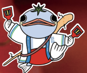
安田町イメージキャラクター あんのろう 「安田朗」