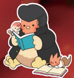
南国市PRキャラクター 「シャモ番長」