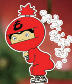
日高村マスコットキャラクター 「もへいくん」 © くさか里樹