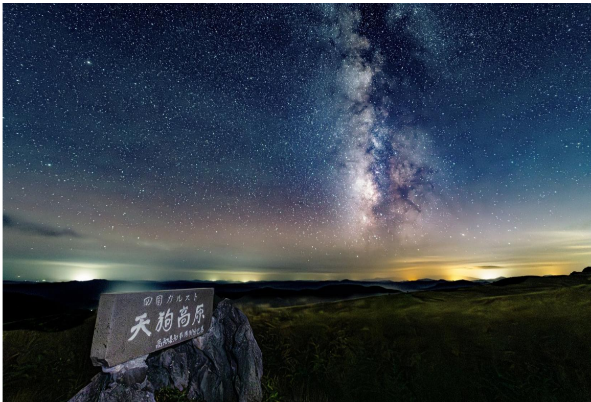
天狗高原の星空(津野町)