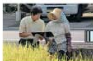
ライフプラン聞き取り