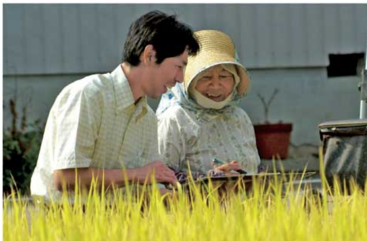
ライフプラン作成のための聞き取り風景