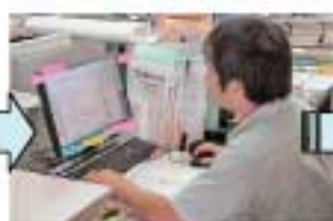
ライフプラン表データ化