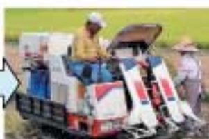
安心した農業人生へ