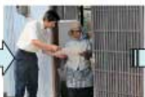
ライフプラン表提案